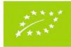
ΑΒ-ΓΔΕ-999 Γεωργία της ΕΕ / εκτός ΕΕ